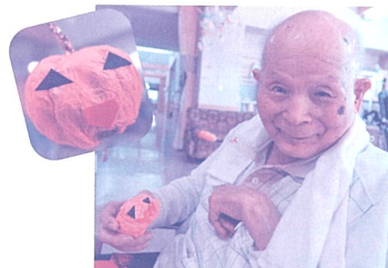
かわいいカボチャになりました