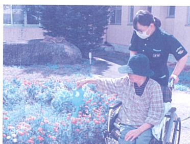
学生さんと花の水やり